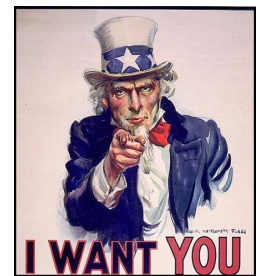
La Comisión Consultiva MRP quiere que USTED ser miembro!